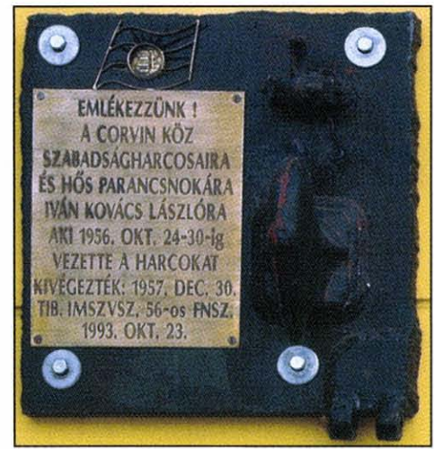
1. tábla (A fotókat készítette és a táblák összeállításának ötletét adta: Rádai Mihály)

„Kócos” ragadványnevű lány szerepel Pongráz Gergely kötetében (Cor-